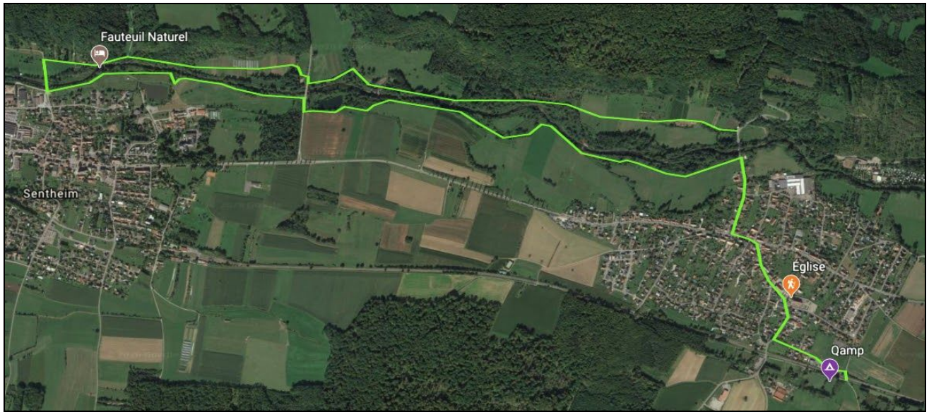
Tracé approximatif de la boucle !