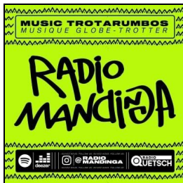
Balisage Mandinga !!