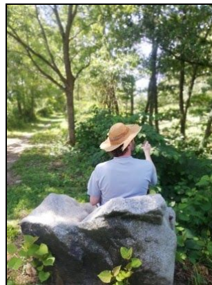
Fauteuil Naturel !!!